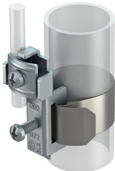
927/S-1: Хомут уземлювання